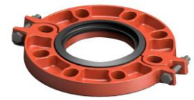
Sơn màu cam