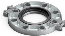
Mạ kẽm nhúng nóng