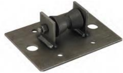
Minh họa chân đỡ con lăn kích cỡ từ 2" đến 3½"

Cách đặt hàng: Vui lòng chỉ định mã sản phẩm