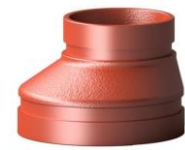
Mạ kẽm nhúng nóng