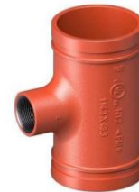
Mạ kẽm nhúng nóng