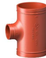
Mạ kẽm nhúng nóng