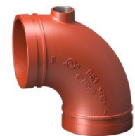
Mạ kẽm nhúng nóng