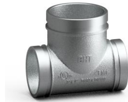
Mạ kẽm nhúng nóng