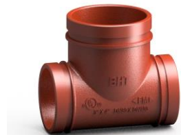
Sơn màu cam