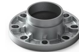
Mạ kẽm nhúng nóng