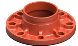
Sơn màu cam